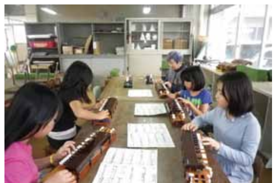
大正琴の活動様子