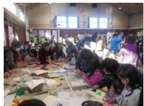
「放課後子どもひろば」の様子