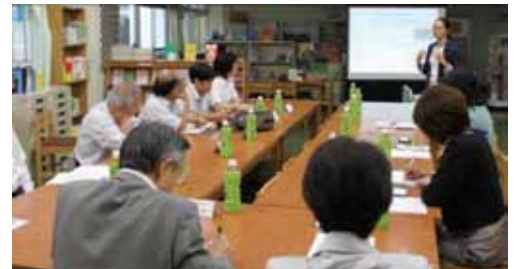
いつも活発な議論がなされる学校運営協議会