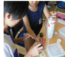
地球温暖化を考える 燃料電池を使用した 「発電実験教室」

土曜学習応援団・WEB URL: http://doyo2.mext.go.jp