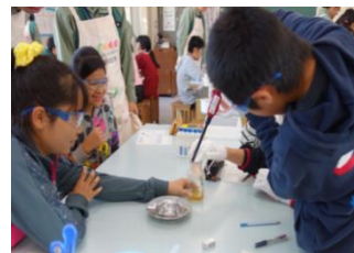
化学の不思議を伝える 「化学実験教室」