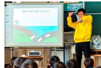
災害に備える力を養う 「防災教室」