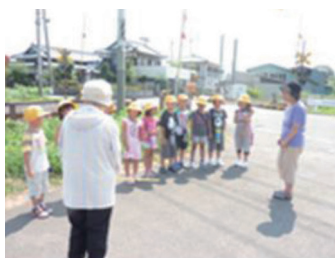
地域の方による交通安全指導