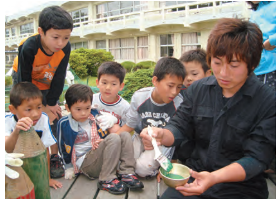
駅伝一日先生（学校をきれいにしよう！）