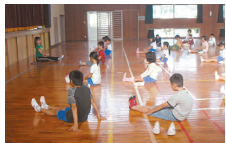
劇団フレンズの活動