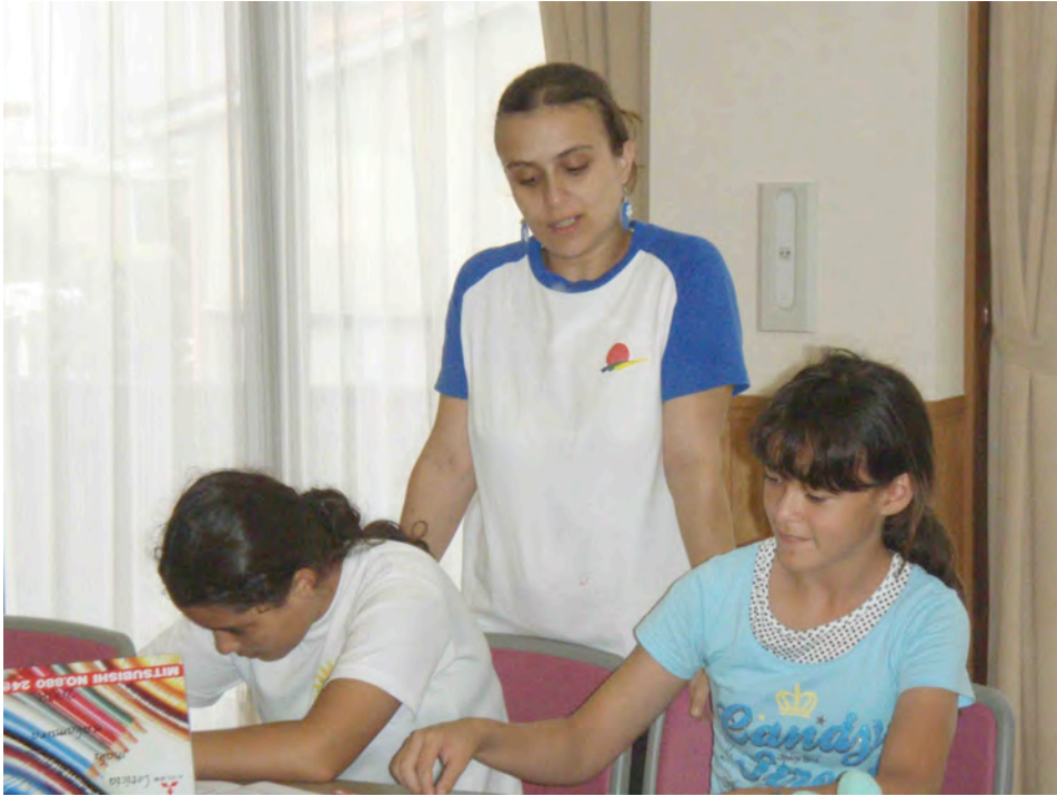
自言語・自文化の中で放課後をのびのびと過ごすことのできる居場所の提供