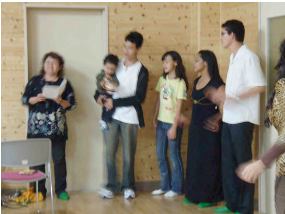
特別支援コーディネーターを核とした特別支援教育研修会の開催