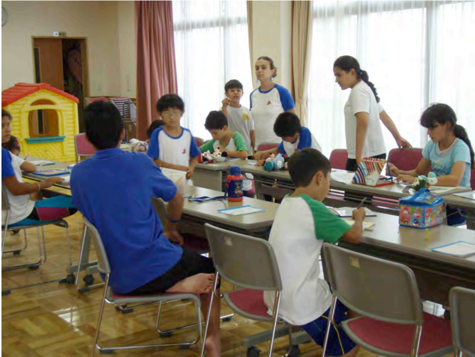
ブラジル人学校の特別支援教育の整備