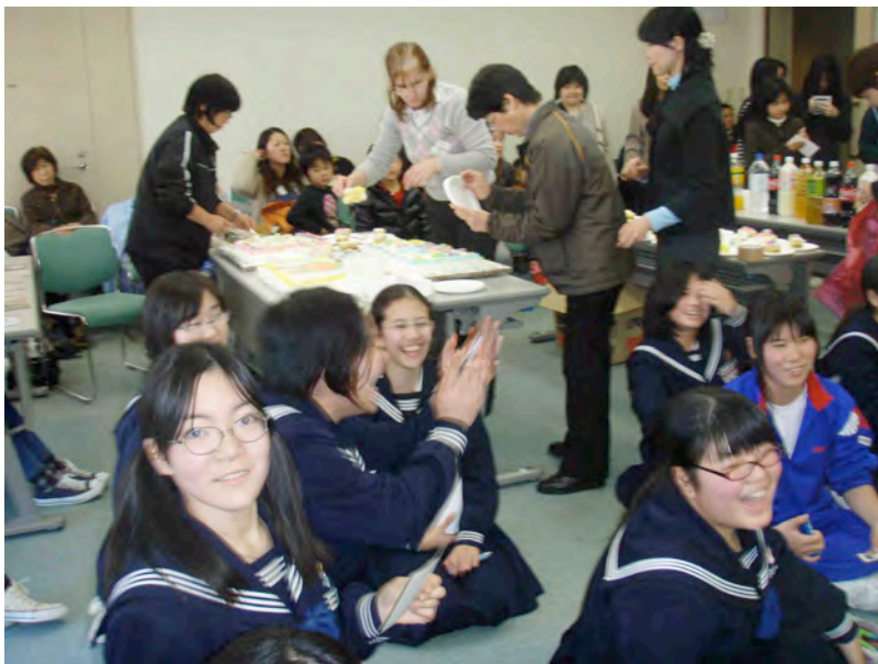
「つくりえとーこどもの美術交流展」交流風景