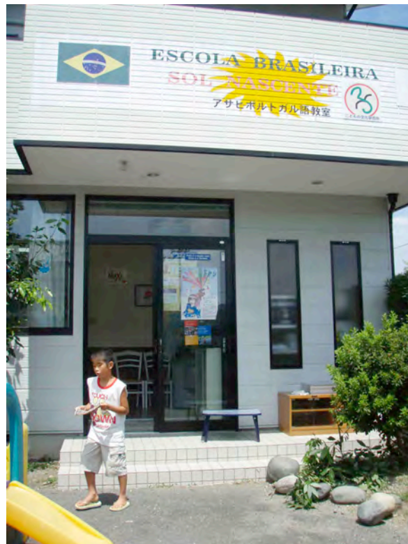
生徒数減少に悩むブラジル人学校活性化による、放課後の子どもの居場所の再生