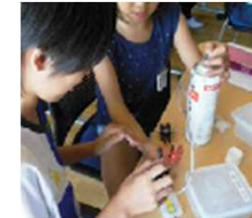
地球温暖化を考える 燃料電池を使用した 「発電実験教室」