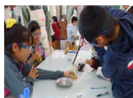
化学の不思議を伝える 「化学実験教室」