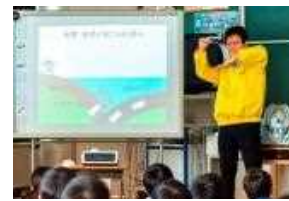
災害に備える力を養う 「防災教室」