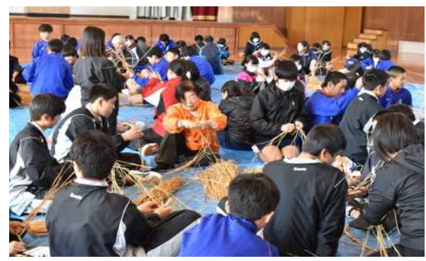
しめ縄づくり体験