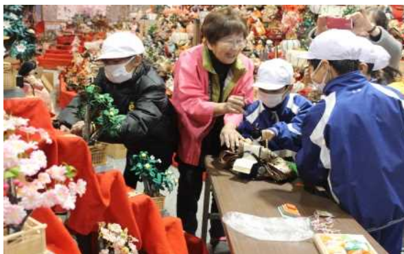
ビッグひな祭り人形飾り付け体験

小学校では、年1回、学校支援に御協力いただいた方をお招きする感謝集会が行われ、児童による感謝状の贈呈や学習の成果発表が行われている。