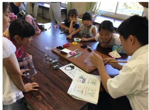
「王寺南小学校 地域連携ものづくり教室」