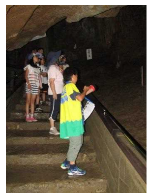
風連鍾乳洞のガイド活動