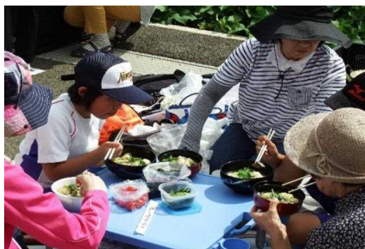
「なべっこ交流会」の交流「だまこ鍋」を食べながら