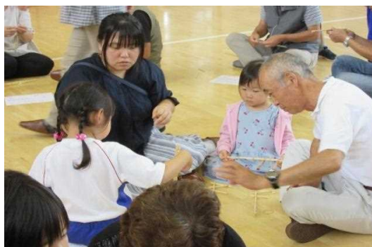
昔遊び体験を伝授する遊び名人から昔遊び

9月には、祖父母や合川小学校地域応援団、公民館サークルの方たちと一緒になべっこ交流会を実施している。地域の遊び名人の方から昔遊び（独楽・メンコ・紙相撲・あや取り等）を教えてもらう。昼食には、秋田名物「だまこ鍋」を一緒に作ったり、食べたりしながら交流を図っている。