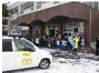
佐渡地域の安心・安全を守るための出発式