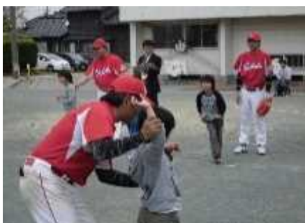
地域の草野球チームによるボールの投げ方教室

放課後の子供の居場所づくりとして、平成30年度に運営協議会を立ち上げ、「八幡っ子放課後子供教室」の取組を開始した。毎回、魅力的な活動が工夫され、多くの参加がある。この取組が新たなボランティアスタッフの掘り起こしにつながった。地域課題学習では、地域の方から地域の課題である「『越の松原』の再生」についてプレゼンテーションソフトを用いて分かりやすい説明があった。