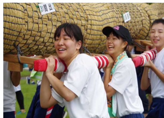
を導事 担を前 いを受け で地地 けの域 てのの 地活日 域性元 の元化 活元気 性元化 化に担 によぎ り方方 に貢大 献のの 。蛇指