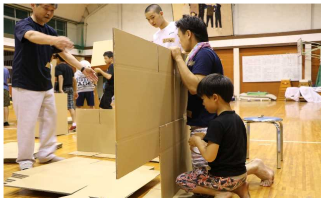
段に防 | 災 | プ | キ | ル | ラ | ャ | ン | プ | 仕 | イ | ン | 切 | リ | シ | で | 作 | り | を | 域 | に | 守 | 住 | 民 | と | 挑 | 戦 | た | め | の | 緒