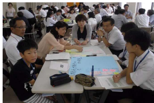
第7回CS研修会in木島平小学校 協議：七 が：参 の加小 子し中 見高 見校 交生 換、i す地 る域 熟住 木島