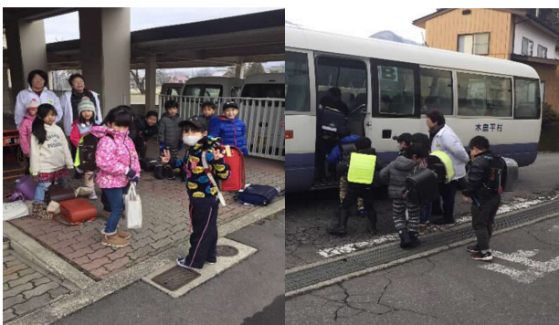
見守りバス利用児童を見守る見守り隊員

本村の小学校5年生は、毎年、東京都八丈町に3泊4日の宿泊体験学習(海の学習)に出掛けている。保護者から前年の4年生で、宿泊体験をさせたいとの要望に応え、学校運営協議会が中心となって4年生の宿泊体験学習を企画・運営を行っている。