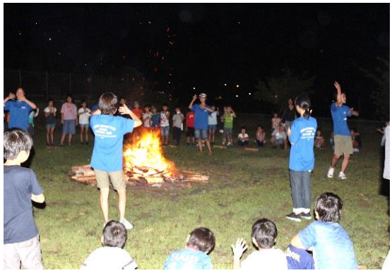
せす宿百 ラるで合 ー小 ジキ小 ュヤこ ニンども アプク キフラ ャイブ ンア夏 プカを ウ指休 ン導み 合