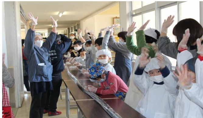
とき百 と地合 ず小 サ小 ポこ ーども タークラブ 「参 加長 児い 童童 巻

2017年の千葉県での事件をきっかけに、8時、3時の児童の登下校時の見守りを地域住民すべてが意識し行動しようと、「8・3運動」に地域全体で取り組んでいる。住民への啓発と推進のノボリを校区内に立て、地域イベントや集会、地域広報紙でも継続的に説明し地道な定着活動を実施中。