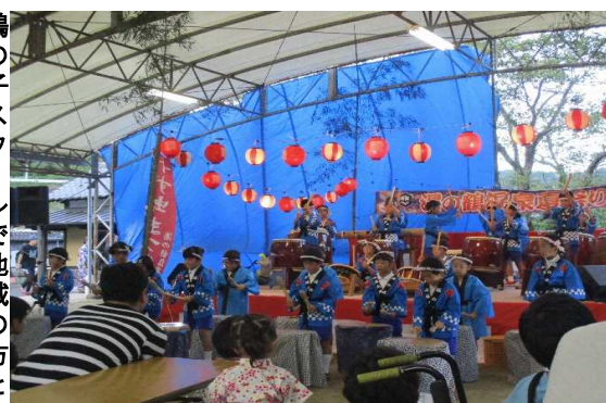
地域の夏祭りに太鼓の演奏