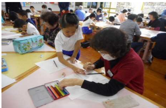
一鶴の子スクールで地域の方と一緒に絵手紙を作成

校区内の各種団体の長が湯出小学校運営協議会のメンバーになっているので、活動に広がりが出ている。