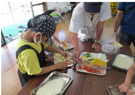
「ピザ作り」地域の活動を支援している。で、子供の活動を先生となっ

青少年育成の日と定められている第3土曜日に地域での活動を推進していることから、校区公民館が中心となり、教員、保育所、長寿会や地域の人たちを指導者に、「キラリ輝く「しぶしっ子」育成事業(土曜体験広場)」を開催している。ピザ作りや軽スポーツ、芋掘りなど、多様な体験活動を実施している。