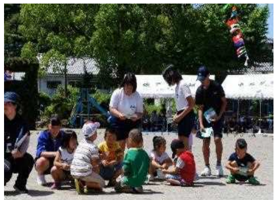
小学校の運動会での協力(ボランティア)による活動の様子