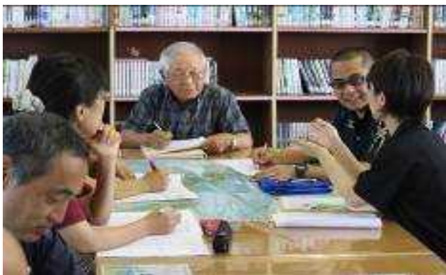
地域学校協働活動推進員と学校教職員との「熟議」の様子

小中連携やボランティア活動の推進を踏まえ、小学校の運動会の役員として中学生が参画している。また、地域の敬老会においては生徒が運営の役割を担い、地域を挙げて高齢者を祝うことへの役割を果たしている。さらに、中学校の体育大会では学校運営協議会の委員も兼ねる地域学校協働活動の推進員が閉会式で体育大会講評を述べ、地域と一体となった体育大会を推進している。