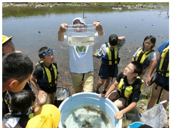
5年生総合で、学習ボランティアによる「魚類を調べる」活動の様子