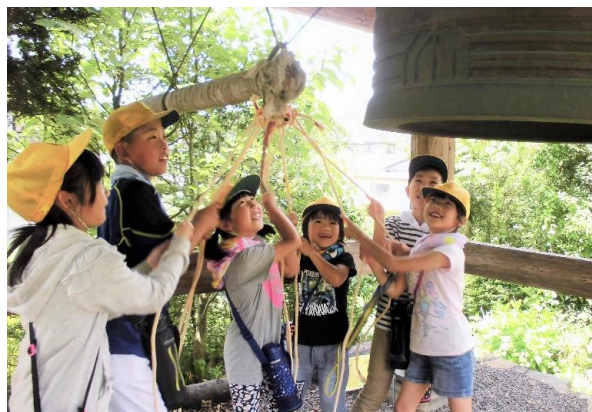
児童会行事「ウッキッキウォークラリー」で地域の寺院を訪ね、鐘つきをしていく様子

校区が広く、集落間が田畑で隔てられた地域であるため、これまで「子ども見守り隊」が組織されていなかった、平成30年度より、自治会の働きかけにより、「方県小校区子ども見守り隊」が立ち上げられ、約30人のボランティアが見守り活動に携わるようになった。