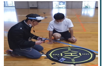
3年生のドリームスクールの様子(生徒150名に対し16名の先生)

総合的な学習の時間、特別活動等でドリームスクールを実施 ①学校と地域学校協働活動推進員が連携し企画立案 ②地域住民等への周知、多様な地域人材の参画促進 ③学校だけでは難しい多様な地域人材によるキャリア教育の充実