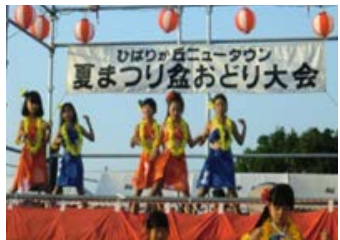
フラダンス（夏祭り参加）