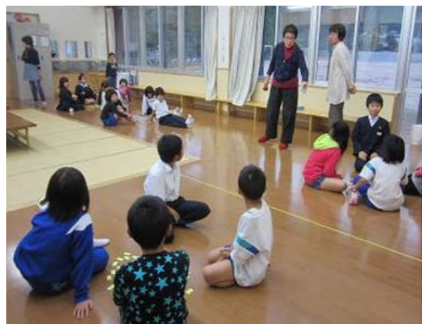
算数かるたの様子