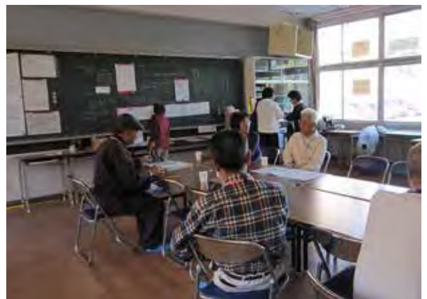
ふれあいルームで、支援の振り返り