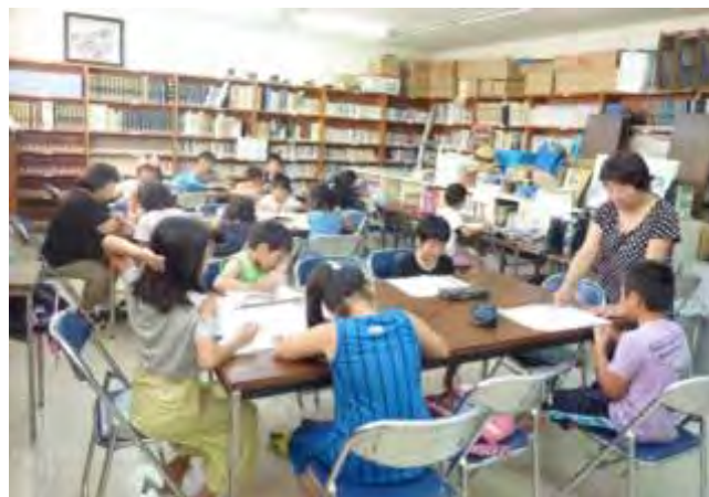
みんなでのびのび宿題