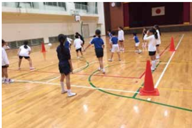
みんなが大好きなドッジボール

○放課後、長期休業中における子供たちが安心・安全で健やかに活動を行える場を確保することができた。 ○体力づくり教室では、体力の向上はもちろん、異なる学年の子供たち同士の活動をとおして、ルールを守ることの大切さ、協調性・チームワークを学ぶことができた。子供たちは、「体を動かすことに楽しさを見いだし、スポーツを始めるきっかけになった」という感想を持ち、保護者の方からも、「他学年の子と同じ環境で活動することは、子供にとって良い経験になる」といった声をいただいた。 ○宿題教室では、子供たちが学習をする習慣を身に付けることができ、教室に通う子供同士で仲良く挨拶する姿が見られるようになった。