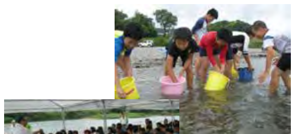
自然体験教室・・・守れ仁淀川

福祉教育(福祉専門学校との連携により6年間で20時間)、自然体験教室(仁淀川流域の山川海環境保全推進協議会との連携 3・5年生)、体力づくり(NPO法人総合クラブとさとの連携)、音楽の授業(ピアノ教室講師との連携)、読み聞かせ(市民図書館との連携)