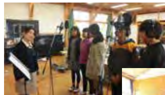
卒業記念に学校のテーマソングづくり