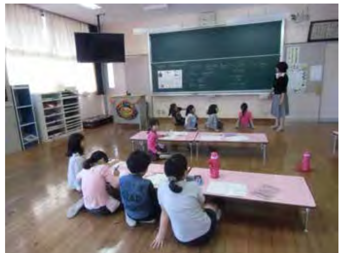
ことばの扉を開こう 英語教室

木工教室（地域の大工さんから教わる木工製作活動） 吉井エコツーリズムの会（町の文化財をめぐる、町のよさを再発見する取組）