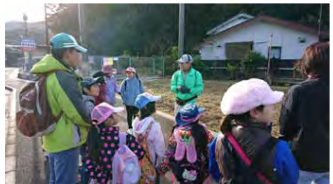
吉井のいいところみつけた 牧の岳遊歩道