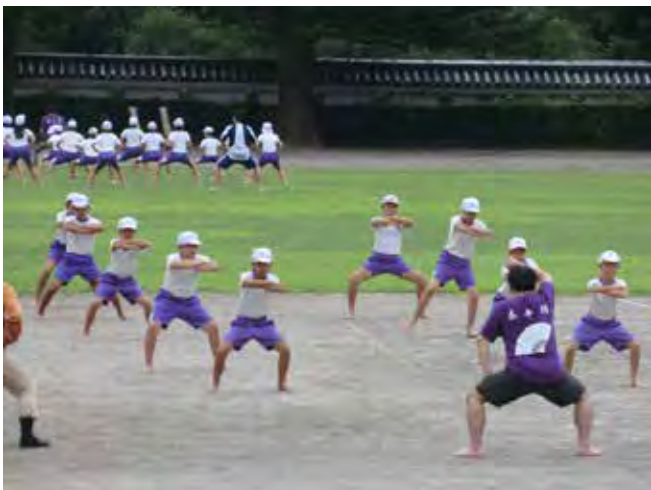
「泰平踊」の指導の様子 (小学校)