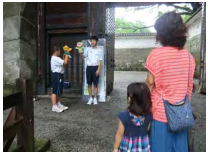
観光ガイドボランティア体験 (中学校)