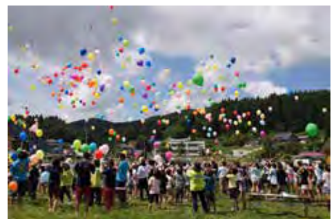
ひまわりの種とメッセージを風船につけて飛ばしたひまわりフェスタ