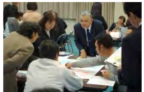
矢島の子供たちに期待することをテーマにした熟議