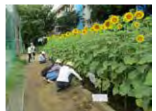
ひまわり作戦（2.8kgの種から約650mlの油が採れました）