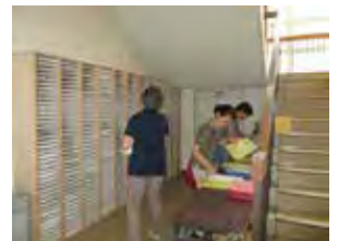
ステップアップタイムに取り組む算数プリントの用意（プリントは440種類あります）

3学期には、全校児童生徒による「感謝の集い」を行い、6年生が制作した刺し子や全校児童による歌のプレゼントなどをして、感謝の気持ちを伝えています。