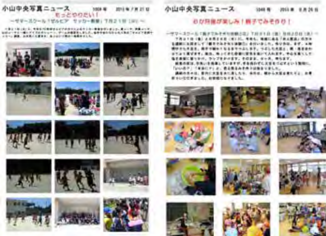
「サマースクール」での「サッカー」・「親子でみそづくり」の様子 ※写真ニュース

教員からは「VCが関わることで、地域との連携による児童の体験的な学習がより充実し、学習内容への理解や新たな知識や発見を深めている」と評価されている。講師には、「楽しかった。子ども達から元氣もらえた。写真ニュースが楽しみ」等、新たな学びややりがいを感じながら活動され、新たな講師人材を紹介していただくなど、学校や児童に関心をもってもらっている。保護者からも、サマースクールや体験学習が充実している、家庭での会話が広がるなどの反響がある。「ボランティアNEWS」を通して活動に関わった方を知り、地域の方が「自分も活動してみたい」と話される声も聞こえてくるようになっている。