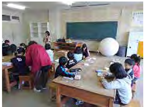
イルフ童画館学芸員の指導で羊毛フェルトのクリスマスオーナメントを作りました

(NPO法人との連携について)「腹話術・手品教室」はNPO法人腹話術友の会の方に指導をお願いし、教室を開設している。教室で使用する腹話術の人形や、手品の道具も手配していただいている。