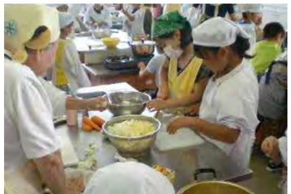
川岸地区食生活改善協議会(すずしろの会)の協力でカレー会を毎年行っています