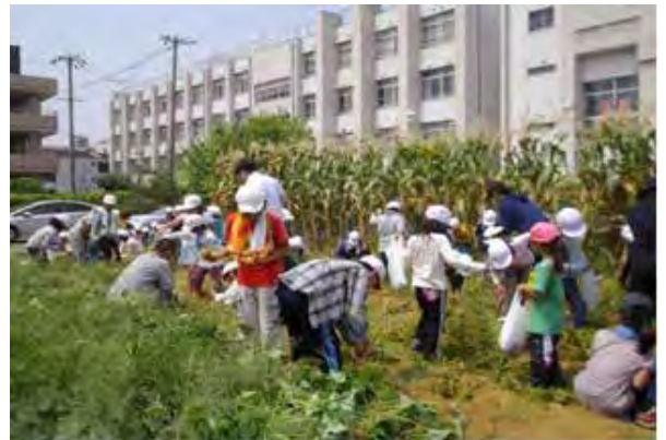
「大空ファーム」でのじゃがいも収穫の様子