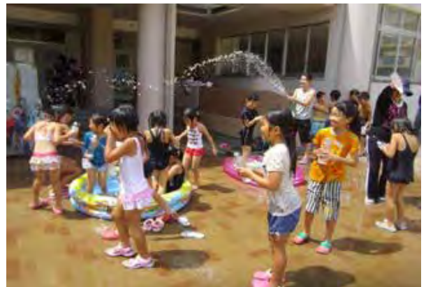
「いきいきミニ夏祭り」