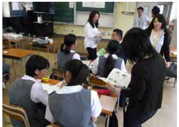
地域の方等を学習支援者とした放課後学習会

毎週木曜日と定期テスト期間等に放課後学習会を実施しており、全校生徒の約半数が、教員が作成したワークシートによるドリル学習や、各自が持参した問題集等による自主学習に取り組んでいる。 生徒と学習支援者が問題を一緒に考えたり、生徒同士が教え合ったりすることで、生徒は、「気軽にサポーターの先生に聞くことができるので、分からないところが少なくなった。次回も参加したいと思った。」「友達みんなが教えてくれてうれしかった。」「学校で1時間勉強でき、家での勉強時間も増えたのでよかった。」など、分かる喜びを実感し、学習意欲や学力が向上するとともに、学習習慣の定着が図られている。