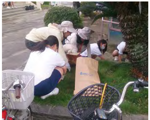
地域清掃活動（クリーンマイタウン二葉）