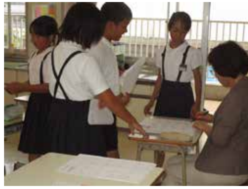
水曜日のスキルアップ

ポイント 地域と学校が熟議により「目指す子供像」を共有しています。子供や学校に関わることで、諸団体の横のつながりができており、学校応援団になっていますね。活動拠点のボランティアルームの役割も大きいですね。