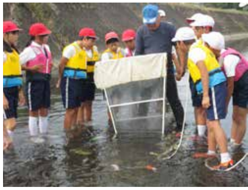
第5学年 総合的な学習の時間 「環境学習（小田川）」