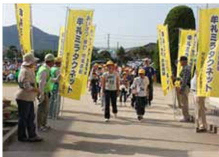
牟礼地域探訪クリーン作戦 出発式のあいさつ運動