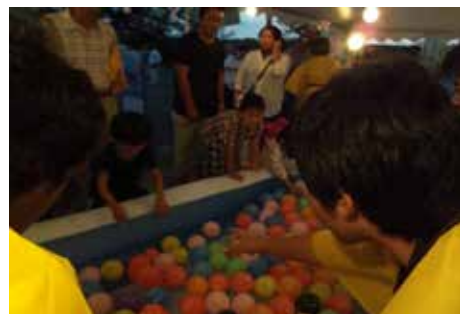
中学生が運営する、夏祭り ヨーヨー釣りコーナー