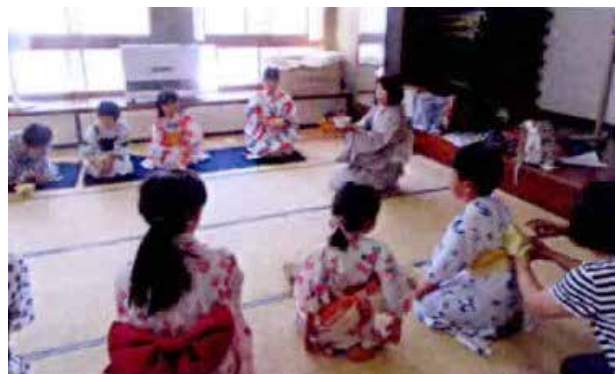
「和の心を知らう」「浴衣を着てお茶を戴く」