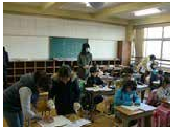
支援員が課題を終了した児童のチェックを行っている様子