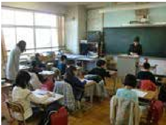
児童は集中して各自のペースで学習を進めている