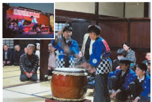
大勢の人の前、めっちゃ緊張！