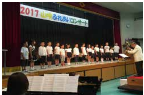
①コーラスタイムで練習した成果をコンサートで発表。

活動の幅を広げようと京都府教育委員会「特別講師派遣事業」等を活用し、「親子料理教室(森永乳業)」・「親子発明教室(関西弁理士会)」・「造形活動(京都SKYセンター)」を実施。企業や大学教授を講師として専門的な活動を実施することができた。