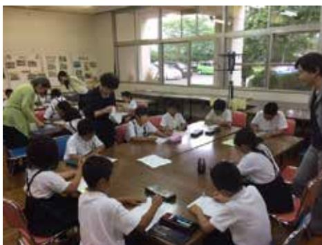
すくすくの様子（丸付け）