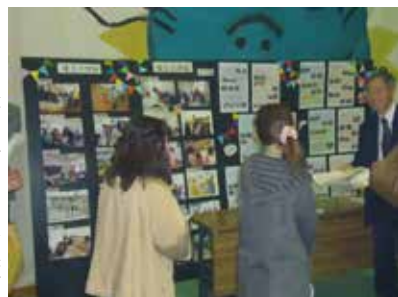
学校運営協議会のブース

今後、「地域コミュニティの中心としての学校」という視点から、校舎改築等に向けた熟議を行うことで、将来を見据えた学校運営の活性化支援を目指している。