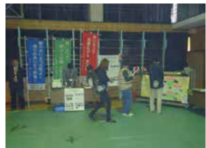
青少年育成町民会議のブース