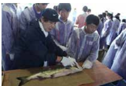
ふるさと科「鮭学習」における新巻鮭作り 漁協・漁師・鮮魚店との連携・協働により実現