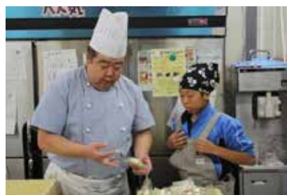
ふるさと科「職場体験」 学校支援地域コーディネーターが研修で学んだ職場体験の進め方を大槌版にアレンジし、町内約70事業者にコンタクトをとり実施。