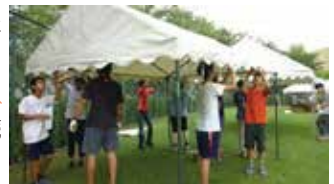
夏祭りボランティア(ジュニアサポーター)