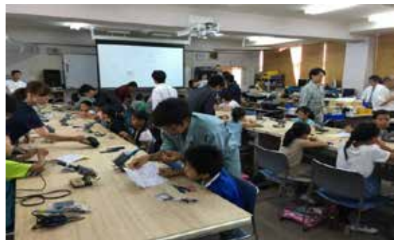
王寺工業高校での科学工作