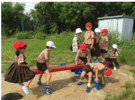
運動場で遊ぶ様子