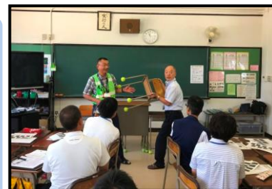
中学校教員に対する不審者対応訓練の様子（市内全ての中学校から1名参加）