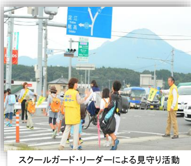
スクールガード・リーダーによる見守り活動