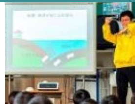
▲災害に備える力を養う「防災教室」